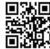
QTCI 2000B TW XTCS 1200IX TW